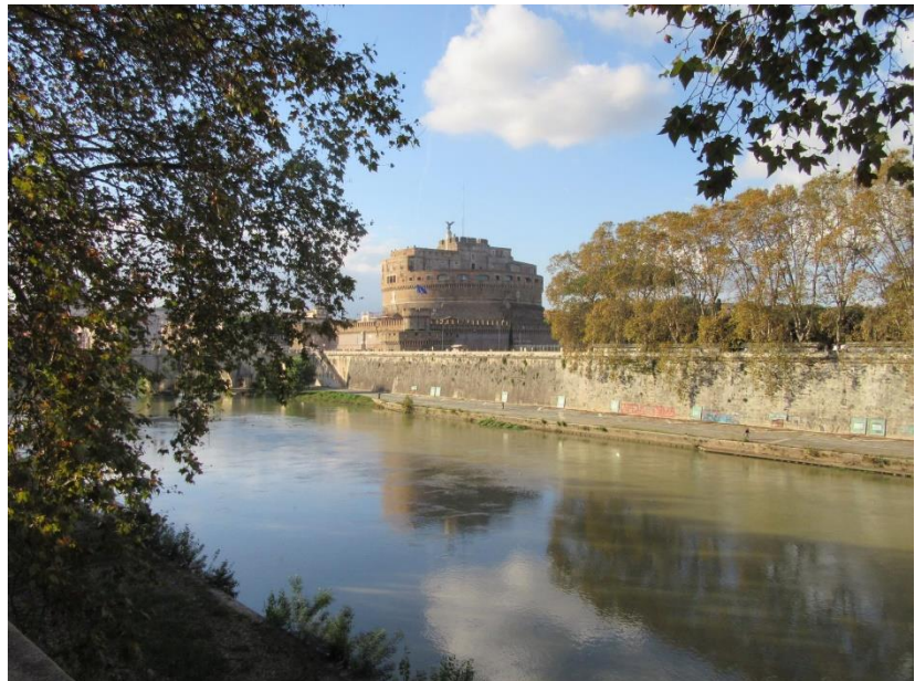
Het mausoleum van Hadrianus en Sabina aan de Tiber