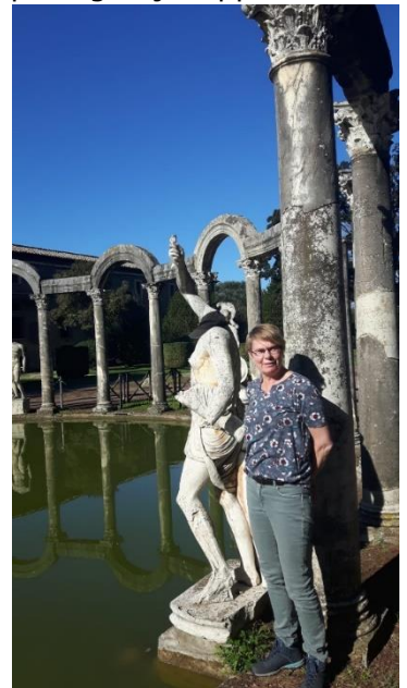
In de Villa Adriana - bij de canoop

Inclusief zijn: 5 nachten logies met royaal ontbijt in ***hotel (op basis van een 2 persoonskamer. De éénpersoonskamer-toeslag is 150,- euro; indien gewenst en mogelijk, bemiddelen wij bij het vinden van een kamergenoot), vliegreis, transfers hotel-vliegveld in Italië, entreprijzen musea en villa Hadriana, vervoer dagexcursie naar de Villa Hadriana per touringcar.